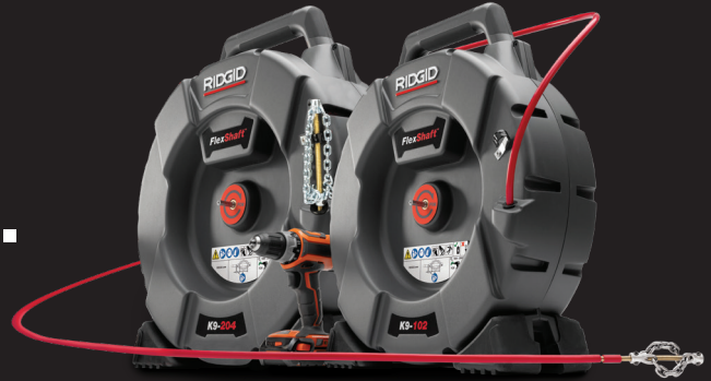
K9-204 MACHINE 64278

Use below table for recommended options based on blockage, pipe size and pipe type.